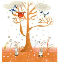
Illustration de l'album « Le nid » écrit par Stéphane Servant